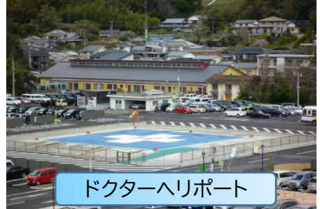
ドクターヘリポート